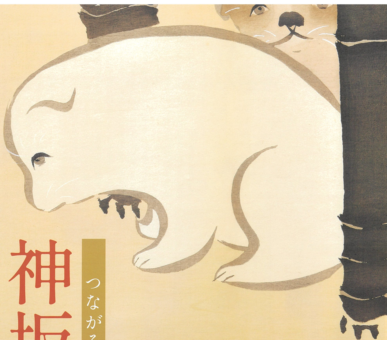
神坂雪佳「百々世草」より「狗児」(部分)明治42~43年刊 細見美術館蔵