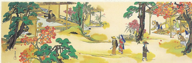
神坂雪佳《光悦村園》昭和初期 個人蔵