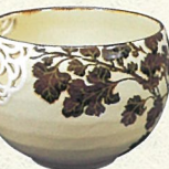
神坂雪佳 図案／河村蜻山 作 《菊透し彫鉢》 明治43年 個人蔵