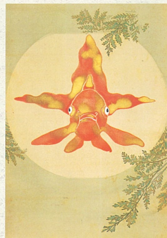
神坂雪佳《金魚玉図》(部分)明治末期 細見美術館蔵