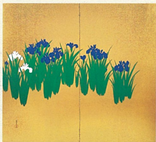
神坂雪佳《杜若図屏風》大正末～昭和初期 個人蔵