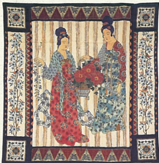
神坂雪佳《天平美人図壁掛》大正末期 個人蔵