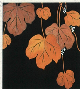
神坂雪佳 図案 (葛の葉園時絵硯箱) 大正10年 個人蔵