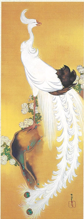
神坂雪佳《白鳳図》昭和2年頃 細見美術館蔵