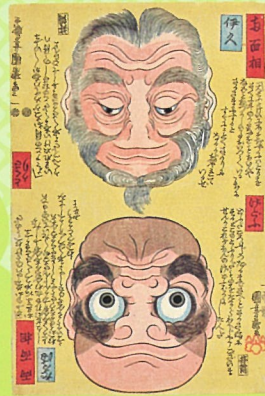
歌川国芳 「両面相 伊久げどふだるまどくさかり」 絵を逆にしても、あれ、人の顔