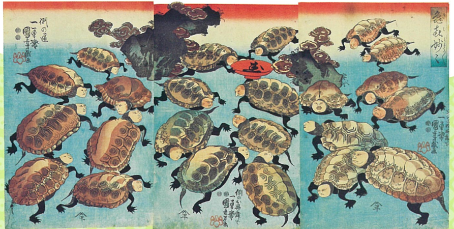
歌川国芳「亀喜妙々」 役者の似顔絵を亀の顔に、甲羅の模様も特定の役者を示すヒントになっています