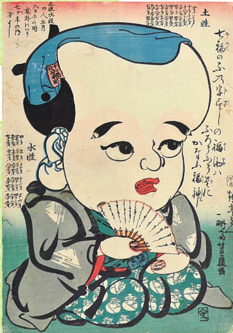
歌川芳藤「有卦絵 ふ尽しの福助」 「ふ」の付く物でできた福助。眉は「筆」、目は「河豚」、口は「房」、耳は「袋」、さて頭は…??