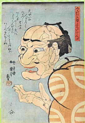
歌川国芳 「みかけハコハるがとんだい・人だ」 国芳の寄せ絵の傑作です、よく見れば、たくさんの人!!人!!人!!