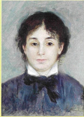
オーギュスト・ルノワール 「青い服を着た若い女」 1876年頃