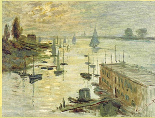
クロード・モネ 「橋から見たアルジャントウイユの泊地」 1874年