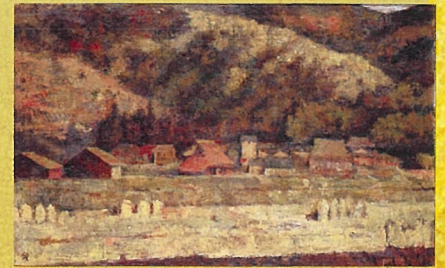
須田國太郎 「信楽」 1935(昭和10)年