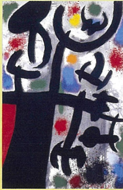
ジョアン・ミロ 「女と鳥」 1968年 © Successió Miró / ADAGP, Paris & JASPAR, Tokyo, 2019 G1872