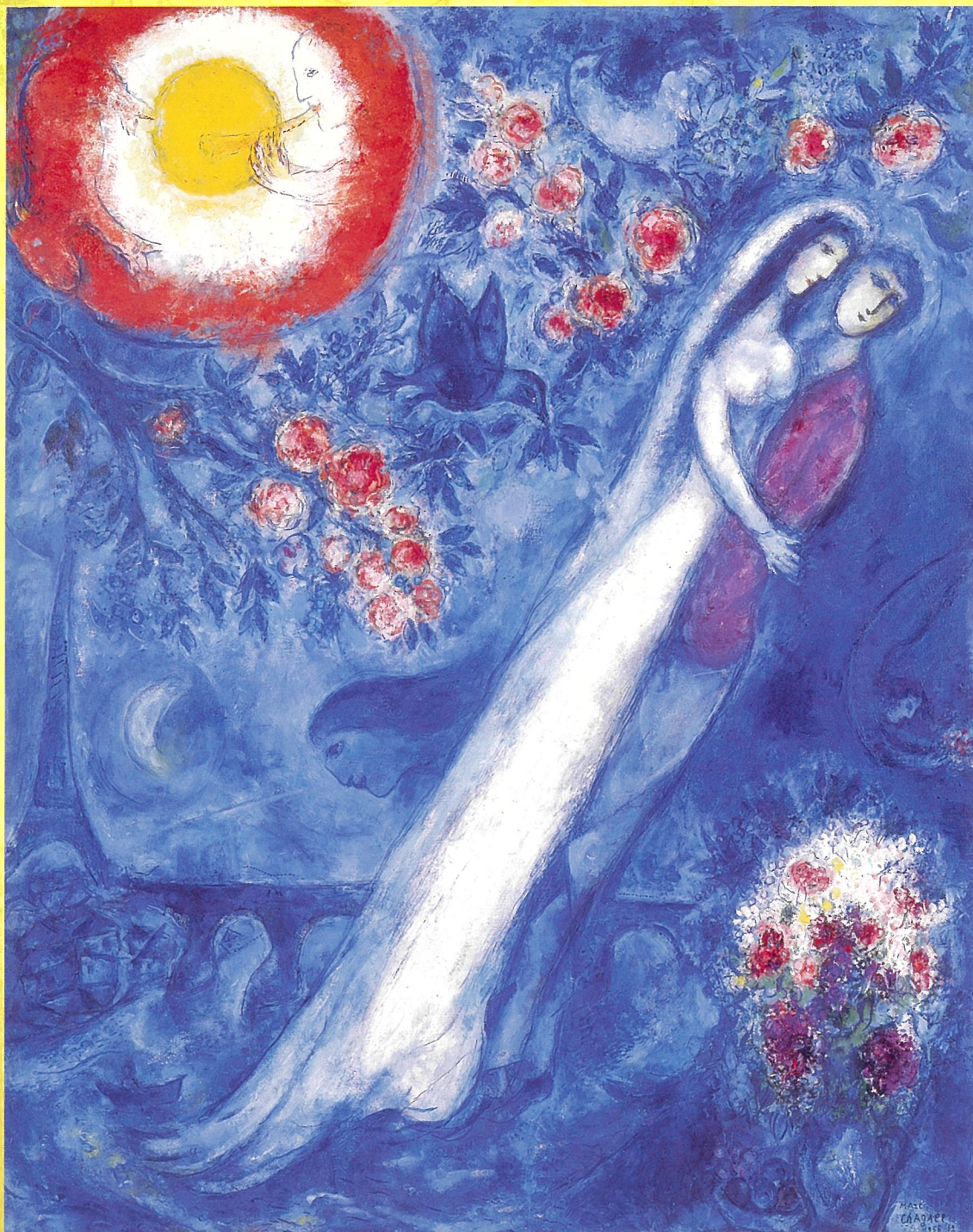
マルク・シャガール 「枝」 1956-62年 三重県立美術館蔵 © ADAGP, Paris & JASPAR, Tokyo, 2019, Chagall® G1872