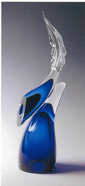
小林 貢 「芽吹き」 2018年