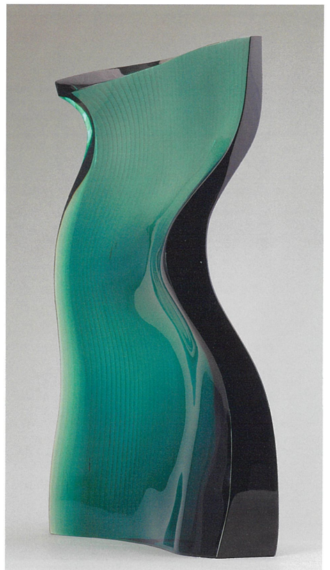
新倉晴比古 「うねり」 2018年