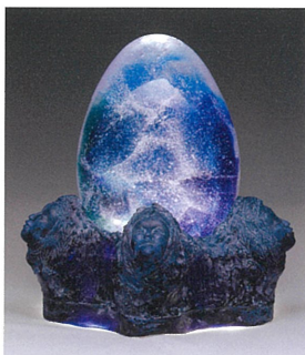
カ石直子 「0<zero>2018-ワタシのココロ」 2018年