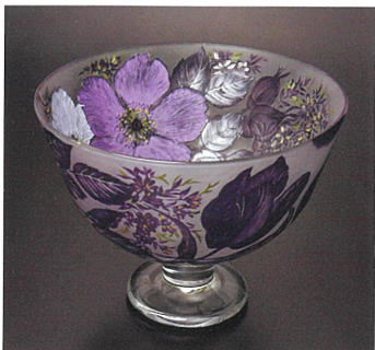
渡部和恵 「ヴァイオレット」 2017年