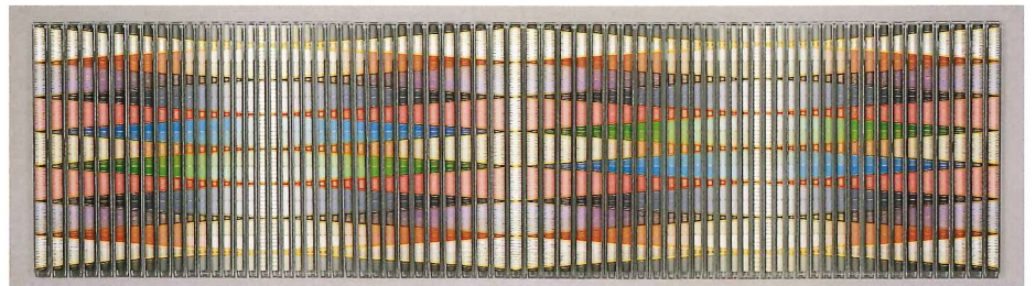
截金ガラス額装「瑠璃放光」 幅3010×奥行70×高830mm