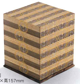
截金飾篭 「日は昇り月は満」 幅136×奥行136×高157mm

截金 (きりかね) 古代より仏像の荘厳(装飾)に用いられる技法。純金箔を数枚焼き合わせたものを鹿皮の盤上で竹の刀で細く切り、それを筆先につけて貼りながら文様を描き出す。13世紀頃には他の仏教美術とともに頂点を極めるが、金泥技法の出現などで衰退し、限られた少数の截金師により伝承されている。