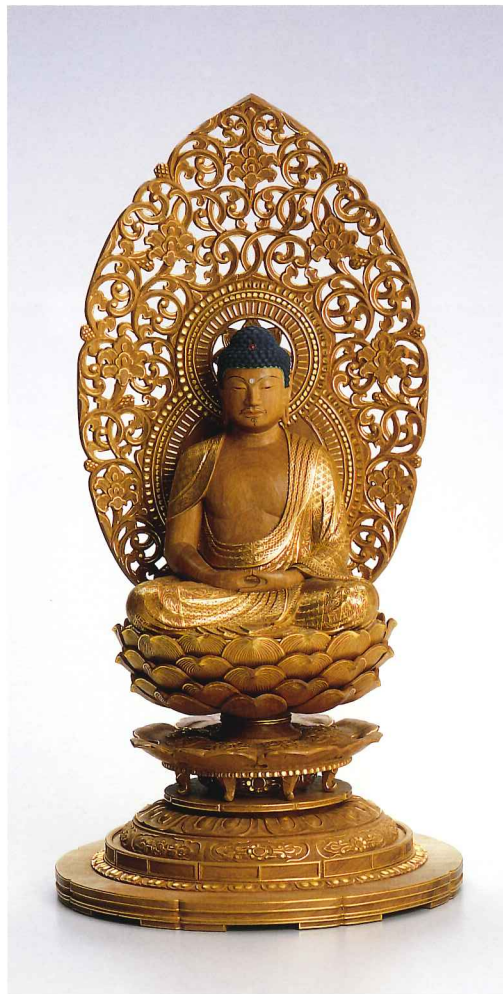
「釈迦如来坐像」 幅145×奥行126×高285mm 2014年