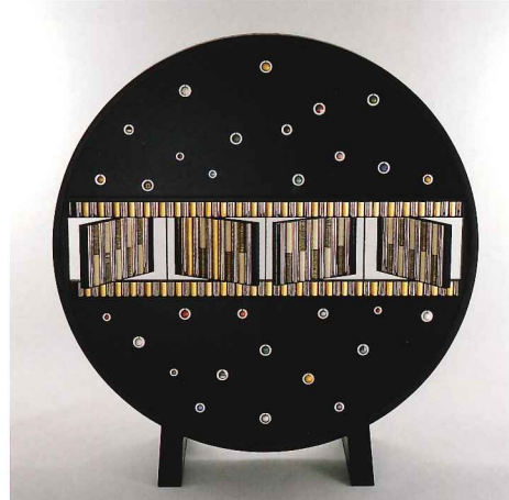
截金スクリーン「そらのあさ、そらのよる」 幅1460×奥行500×高1500mm 2001年