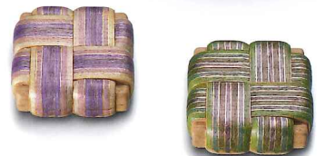
「截金彩色糸巻香盒」 (各) 幅74×奥行74×高25mm 2007年