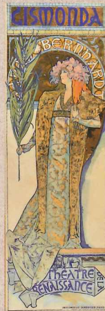
「ジスモンダ」(1894) リトグラフ