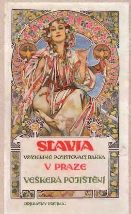
「スラヴィア銀行」(1907) リトグラフ

現代でも高い人気を誇るチェコのモラヴィア出身の画家、アルフォンス・ミュシャ(1860~1939)。挿絵画家として出発したミュシャは、1894年に女優サラ・ベルナル主演の《ジスモンダ》のポスターを手掛けたことにより、アール・ヌーヴォー華やく世紀末のパリに一夜にしてその名前が知れ渡りました。以降、サラ・ベルナルの舞台ポスターをはじめ、さまざまな商業広告や雑誌、さらには、1900年パリ万国博覧会における国や企業のパヴィリオン内部装飾にも携わるなど、ミュシャの才能は華々しく開花します。パリで成功を収めたのち、かねてより芸術を通じて祖国に貢献したいと考えていたミュシャは、1910年に生まれ故郷のチェコに戻ります。愛国心、民族愛に溢れた作品を制作し、新生チェコの切手や貨幣のデザインといった公共の仕事を手掛け、最晩年まで精力的に活動を続けました。