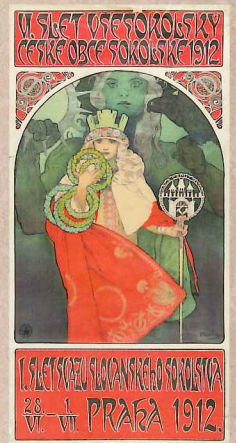
「第6回ソコル祭」(1912) リトグラフ