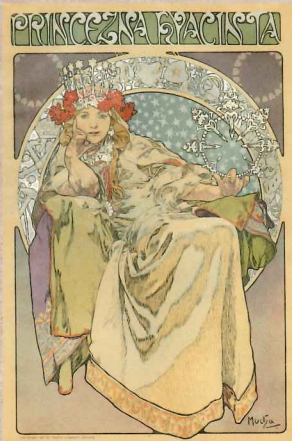
「ヒヤシンス姫」(1911) リトグラフ