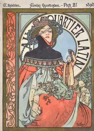
「オー・カルテ・ラタン」誌 特別号 (1898) リトグラフ