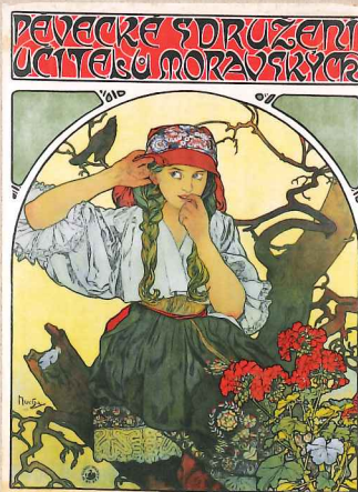
「モラヴィア教師合唱団」(1911) リトグラフ