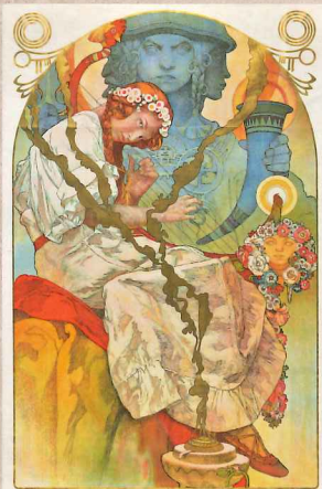
「(スラヴ叙事詩)展」(1928) リトグラフ