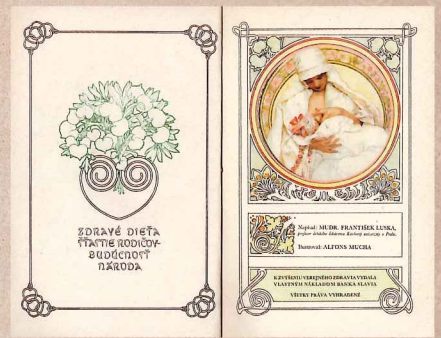
フランティšekスカカ著「スラヴィア、思いやり深い母達に」(1934) オフセット印刷

本展覧会は、チェコの医学博士ズデニク・チマル氏が祖父母の代より収集したチマル・コレクションを中心に、油彩、水彩、素描、カラーリトグラフによるポスター、装飾パネル、挿絵など160点を展示するもので、そのうち30点以上が日本初公開となります。故国モラヴィアとパリで花開いたミュシャの芸術をお楽しみください。