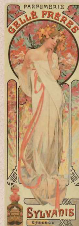
「ジェレ・フレール香水店のシルヴァニス・エッセンス」(1899) リトグラフ