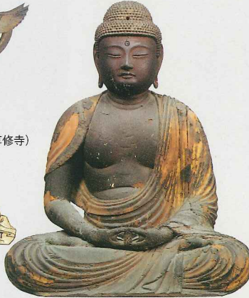
阿弥陀如来坐像(顕正寺 県指定)