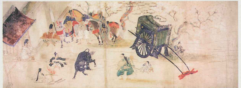
善信聖人親鸞伝絵(専修寺 重要文化財)