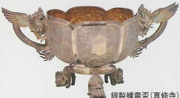
銀製蟠竜盃(専修寺)