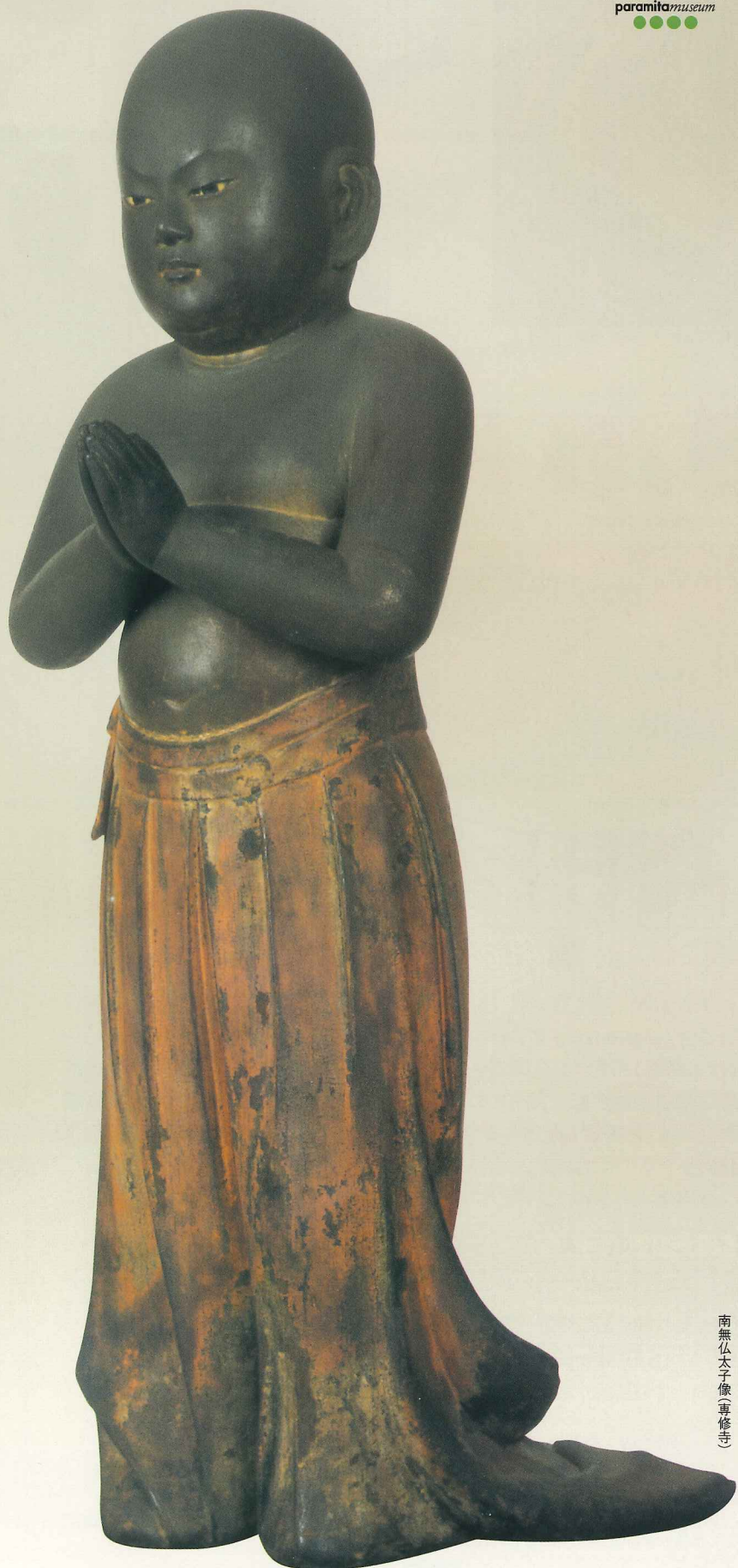
南無仏太子像(専修寺)