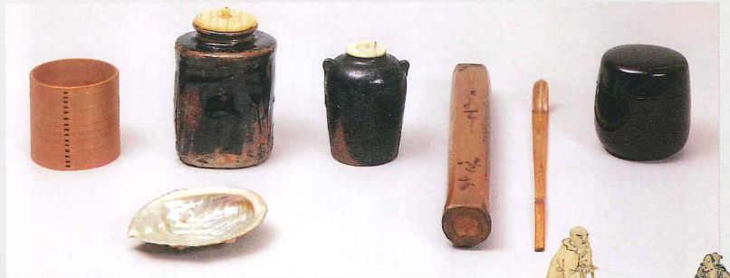
圓道上人所用茶器(専修寺)