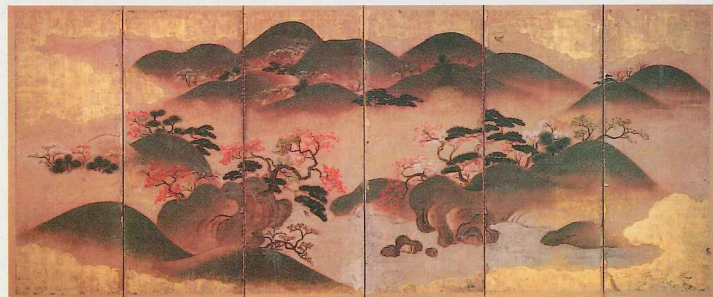
春秋山水図屏風(専修寺)