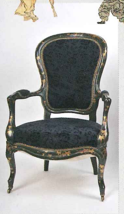
明治天皇御椅子(専修寺)