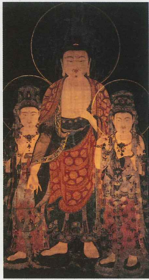
阿弥陀三尊像(専修寺 重要文化財)