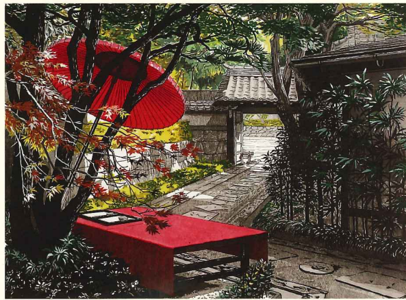
『涼庭忘夏』 2008年 第40回日展入選