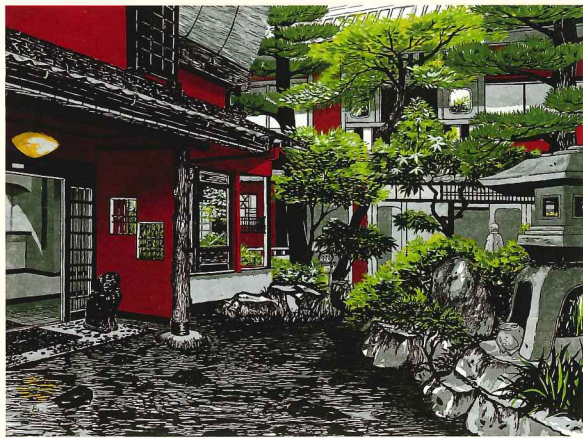
『紅楼依縁』 2005年 第37回日展特選