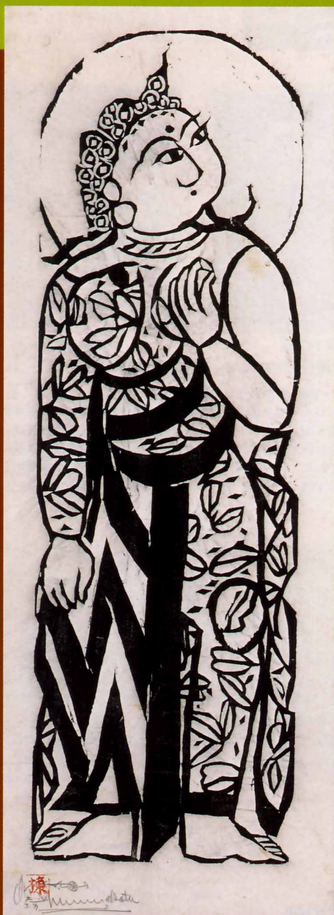
『二菩薩釈迦十大弟子板画柵』より「普賢菩薩の柵」 六曲一双屏風、パラミタミュージアム所蔵