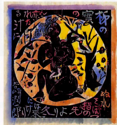
『歌々板画柵』全24柵より「冬来の柵」 歌 谷崎潤一郎 大原美術館所蔵