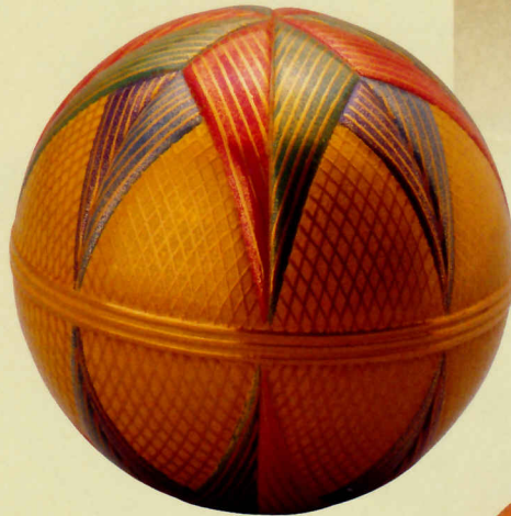
絹代(針谷絹代) 手鞠 黄楊、蒔絵 1996年