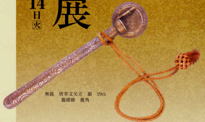
無銘 唐草文矢立 銀 19th 龍緒締 鹿角