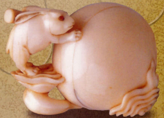
重正 月に兎 象牙 19th