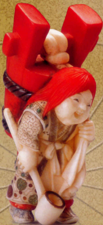
光雲(高村光蔵) 狸々 象牙象嵌 19th

入館料=一般1,000円(4枚セット券3,000円) 大学生800円/高校500円/中学生以下無料