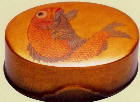
雲龍庵(北村辰夫) 鯛(箱根付) 蒔絵

ポケットの無い和服は「提げ物」と呼ばれる印籠、煙草入れなどの小物入れを帯からつるして着用しました。根付はその提げ紐が帯から抜けるのを防ぐための留め具でした。洋装の現代では実用品としての役目は終わりましたが、小さな世界にウィットと美意識の凝集された工芸品として海外でも高い評価を受けています。