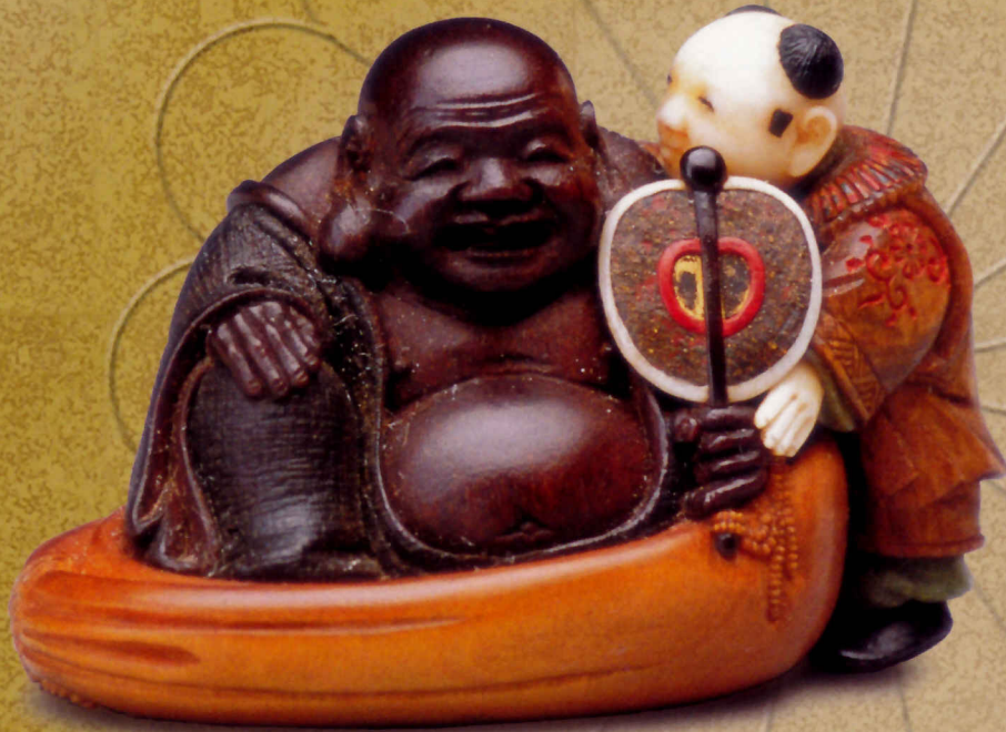
東谷(鈴木鐵五郎) 布袋に唐子 象牙、黄楊、黒檀 19th