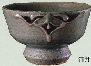
河井寛次郎 泥青瓷菱文筒描碗