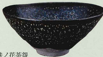
清水卯一 蓬萊鉄ノ花茶盃