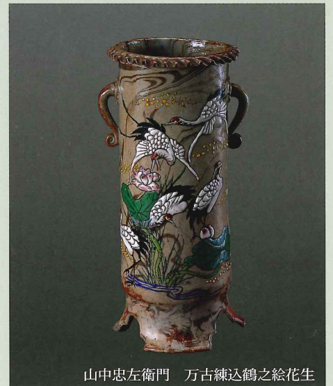
山中忠左衛門 万古練込鶴之絵花生