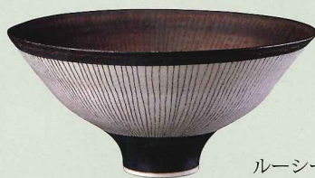
ルーシー・リー 鉢