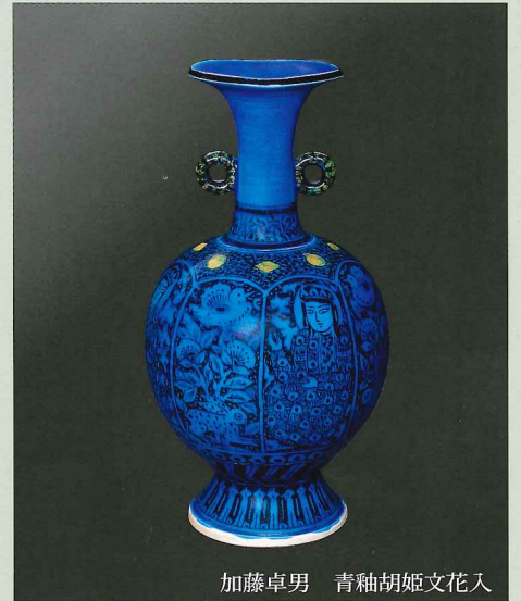
加藤卓男 青釉胡姬文花入