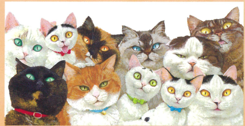
「ねことねこ」原画 こぐま社 2019年