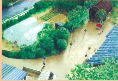
「あずきとぎ」原画 岩崎書店 2015年