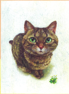
「なまへのないねこ」原画 小峰書店 2019年