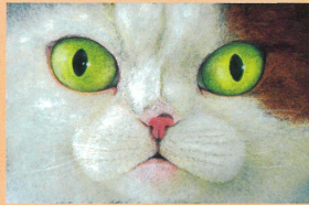
「ネコツメのよる」原画 岩崎書店 2021年 (WAVE出版 2016年)