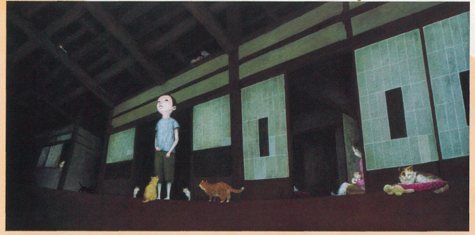
「いるのいないの」原画 岩崎書店 2012年