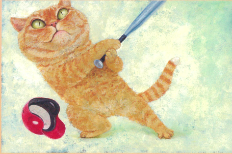
「ねこはるすばん」原画 ほるぷ出版 2020年