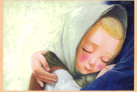
「マッチウリのしょうじょ」原画 フレーベル館 2018年