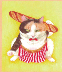
「どすこいみいちゃんパンやさん」原画 ほるぷ出版 2023年