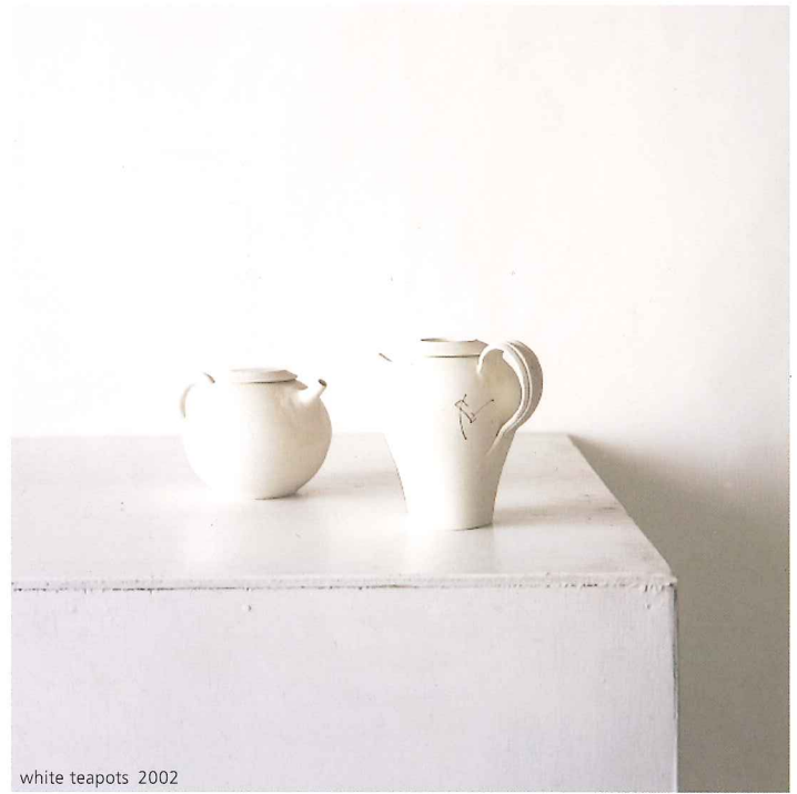
white teapots 2002